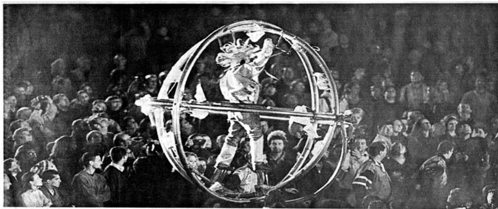
La sphère infernale, l'une des curiosités de mise en scène des Plasticiens Volants.